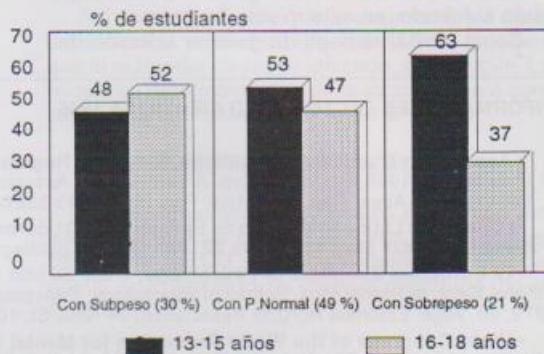
Cuadro 1: PORCENTAJE DE ESTUDIANTES CON PESO NORMAL, SUBPESO O SOBREPESO (total de 286 estudiantes -100 %)

El DSM-IV estima que entre el 90-95 % son mujeres y 1 de cada 100 adolescentes son anoréxicas..